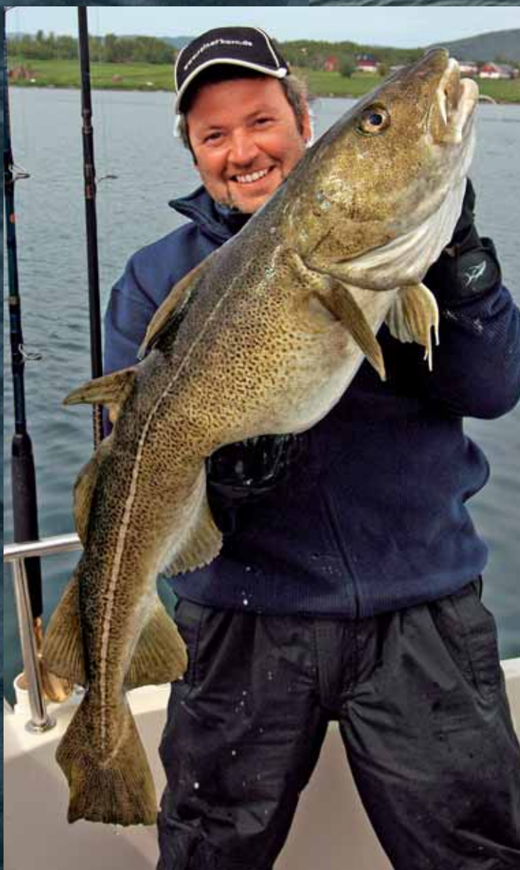
Nicht ungewöhnlich am Skjerstadfjord: Heilbutt auf Gummifisch (gr. Foto). Rainer Korn mit nettem 20-pfündigem Dorschbeifang beim Buttangeln