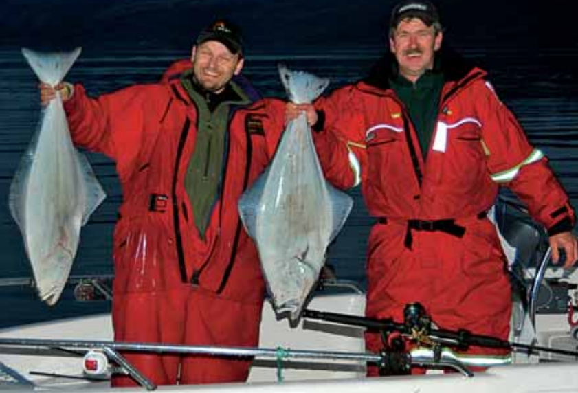
Die schwedischen Kollegen machten es uns vor und fingen jeden Tag zwei schöne Butts beim Schleppen mit Wobblern